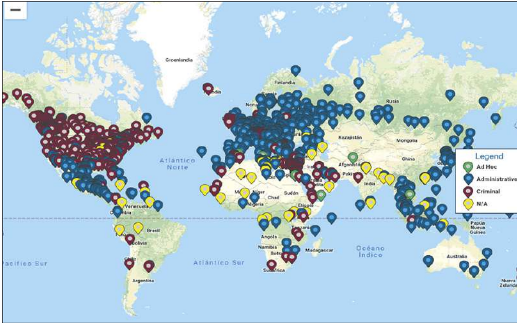
Gráfico 1. Centros de detención de migrantes en el mundo