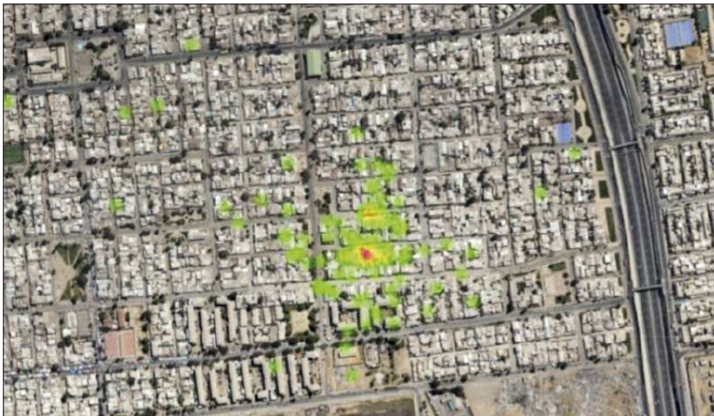
Mapa 1. Estadística geoespacial generada por un sistema de detección de disparos