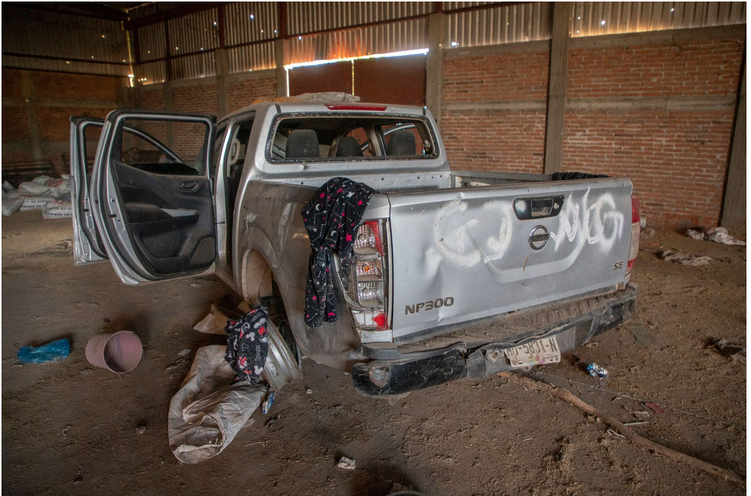
Una camioneta abandonada, en El Aguaje, municipio de Aguililla.

mas buscado por México y Estados Unidos y desde abril de 2019 a los enfrentamientos encabezados por su gente se añaden bloqueos viales y cortes de electricidad en toda la región de Tierra Caliente.