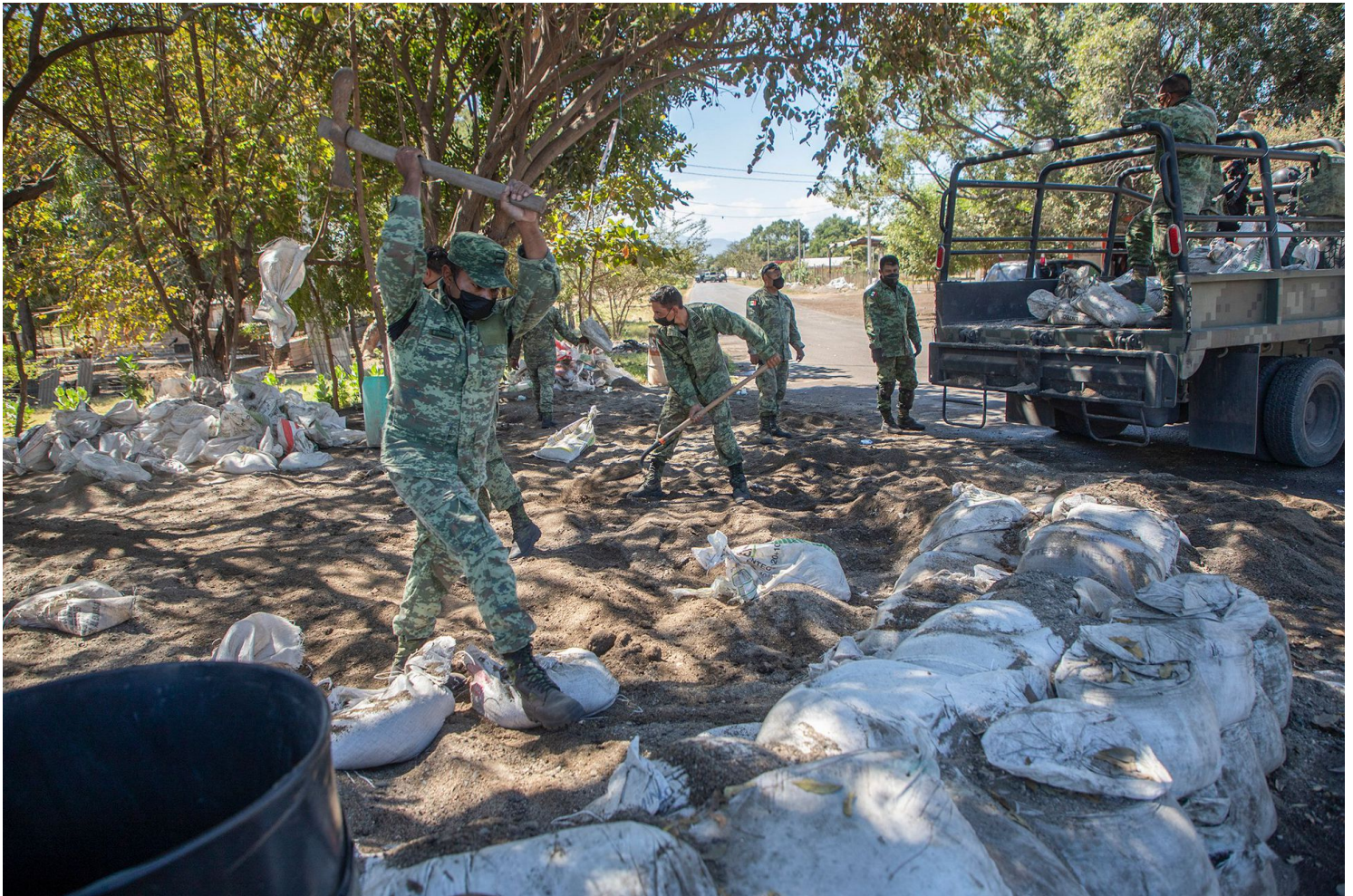
Elementos del Ejército mexicano desmantelan barricada en Aguililla, el 9 de febrero.

En cuanto a efectos prácticos, la llegada de los soldados deja un escaso balance. En una zona fuertemente armada como Aguililla no hubo detenciones y las autoridades se incautaron de seis armas largas, 23 artefactos explosivos improvisados, 21 vehículos, tres de ellos con blindaje artesanal, y equipo como emisoras de radio o chalecos antibalas. En lo que a los caminos se refiere, se logró restablecer el tránsito libre en 43 localidades ubicadas en los municipios de Aguililla, Buenavista, Coalcomán y Tepalcatepec, señalaron las autoridades.