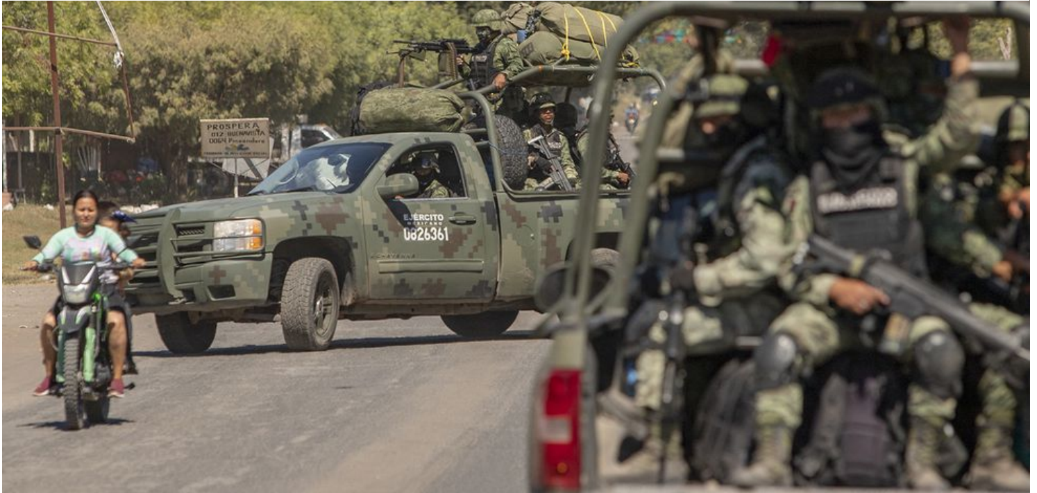
Elementos del Ejército Mexicano patrullan las calles de Aguililla, Michoacán, el 9 de febrero.